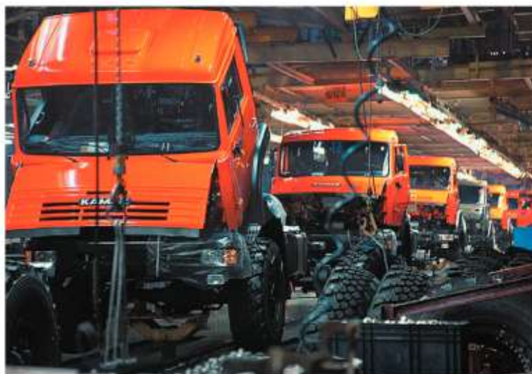
Конвейер Камского автозавода

В годы девятой (1971 — 1975) и десятой (1976 — 1980) пятилеток продолжался рост объемов производства. В эти годы вступил в строй Камский автозавод, пущены крупнейшие в СССР Красноярская и Саяно-Шушенская ГЭС, начал работу Волжский автомобильный завод в Тольятти, начинается строительство Байкало-Амурской магистрали (БАМ).