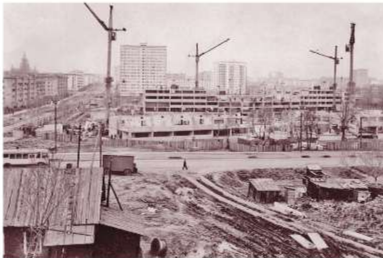
Новостройки в Москве 70-х гг. XX в.

Несмотря на рост благосостояния (ныне 70-е гг. XX в. считаются лучшими по этому показателю во всей отечественной истории), значительная часть населения была недовольна своим положением.